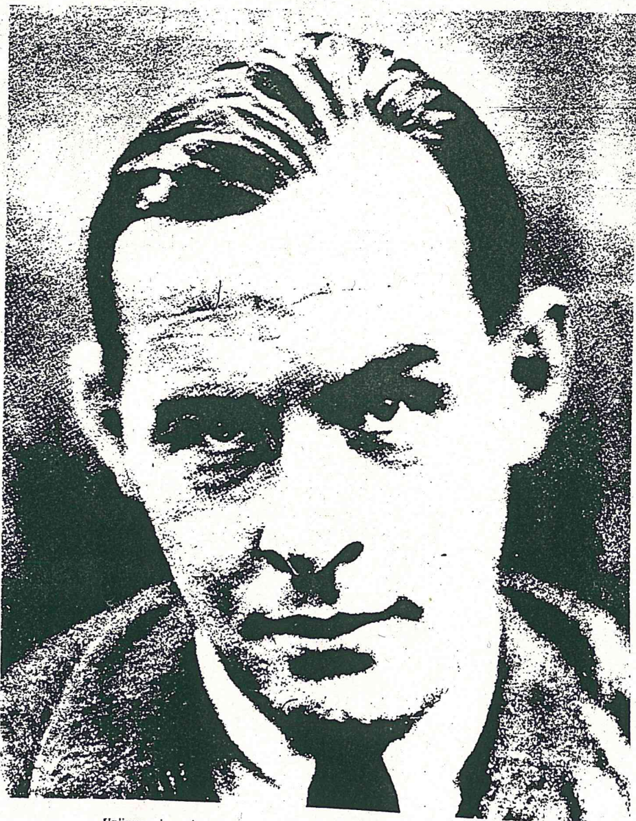
Un'immagine giovanile di Enrico Maria Remarque. Lo scrittore lasciò Berlino cinque giorni prima dell'avvento di Hitler al potere, rimanendo lontano dalla patria fino al termine della seconda guerra mondiale. Malgrado fosse nato da una famiglia cattolica, originaria della Renania, Remarque fu accusato dalla propaganda nazista di essere uno "sporco ebreo". Il nuovo libro si chiamerà "Lisbona"