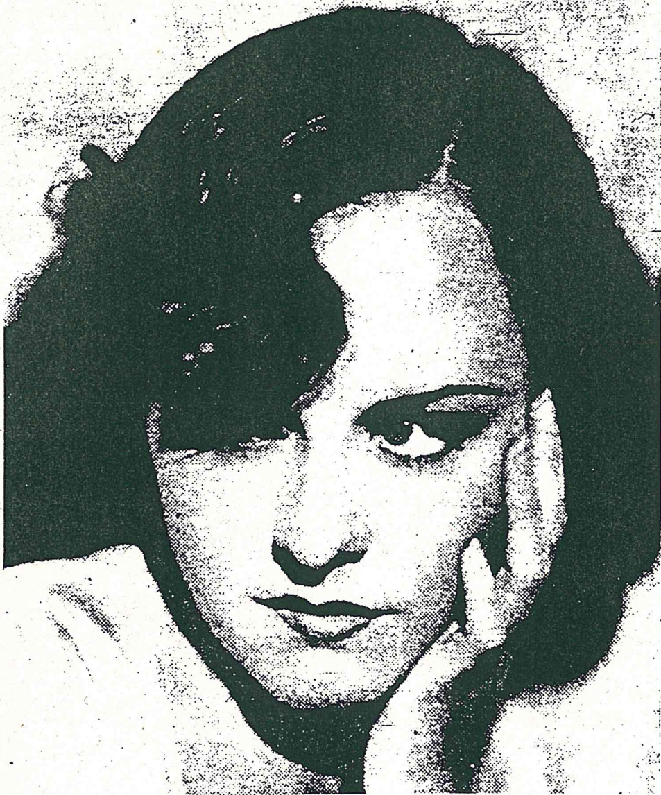
La lontanissima immagine di Paulette Goddard al tempo della sua scoperta cinematografica, nel 1931, con "Luci della città", di Chaplin. Impersonava, nel film che furono prodotti da Chaplin quasi sulla sua misura, la fanciulla derelitta e costretta a vivere in un ambiente di miserie morali e materiali: fu una delle pochissime "protagoniste" dei film di Chaplin dei quali egli era "Numero Uno".