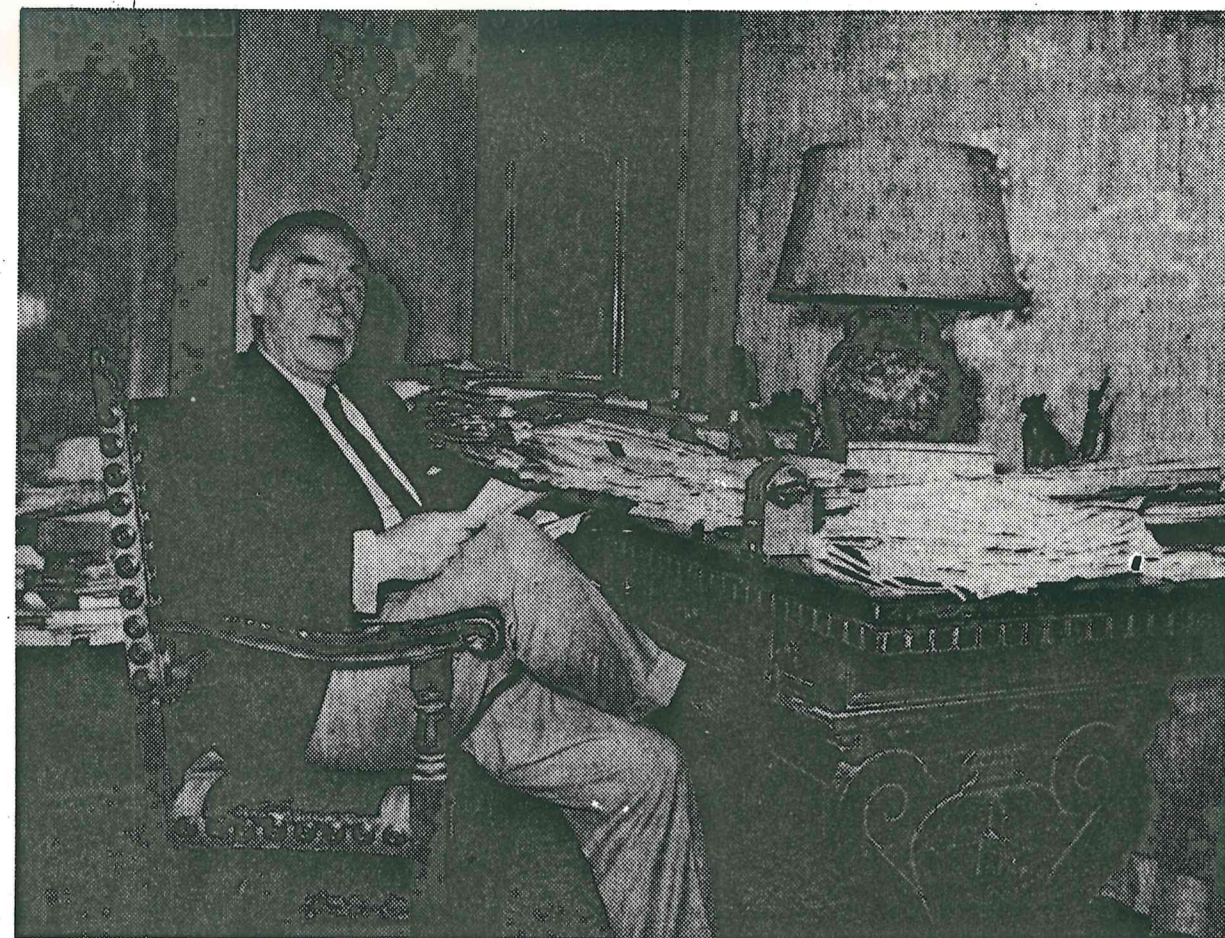
Produktiv und schreibfaul zugleich: Zahllose Briefe warten auf Antwort

In seiner Tessiner Ecke, da wo Locarno und Ascona sich im Stille von