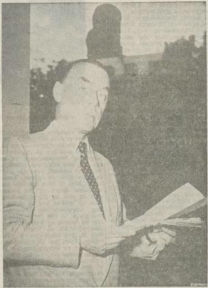
Erich Maria Remarque.

For den unge generasjonen tyskere står Remarque i dag som noe av en ensom figur, og som en halvt utvisket legende. Hans landsmenn betrakter ham som en person uten noen reell tilknytning til dagens samfunnsliv i Tyskland, og Remarque diskuterer ikke med dem. Han innrømmer at «hans verden» er tilintetgjort.